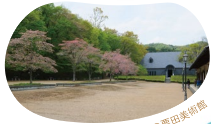
会場の栗田美術館